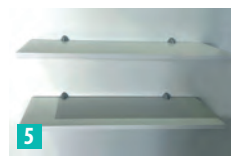
Beispiel: Regalwand (weiss)